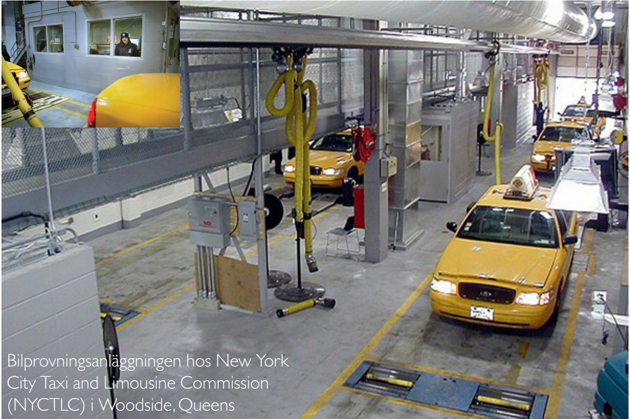
Bilprovningsanläggningen hos New York City Taxi and Limousine Commission (NYCTLC) i Woodside, Queens